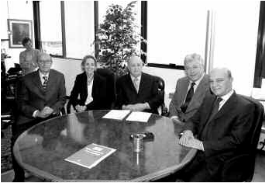
Alla firma dell'atto costitutivo della Fondazione